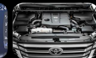
Motor V6 Twin Turbo de 3.5 L