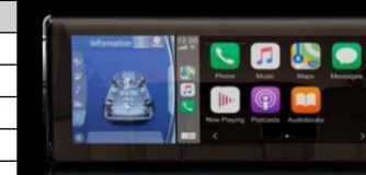
Pantalla de infoentretenimiento con Apple Car Play/Android Auto