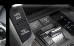
Panel de control para funciones todo terreno (4x4)