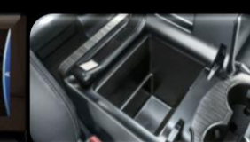
Consola de enfriamiento (Cool Box)