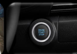
Encendido de motor inteligente