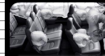
7 bolsas de aire