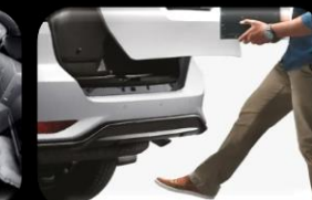
Compuerta trasera con sensor de apertura