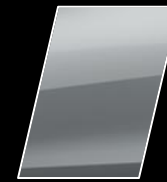
Plata Metalizado (1E7)