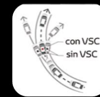
Control de estabilidad del vehículo VSC