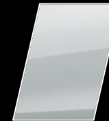
Super Blanco II (040)