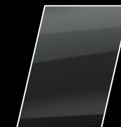
Gris Metálico (1G3)