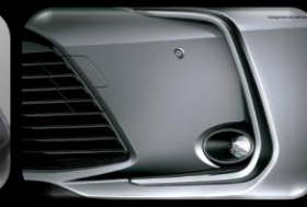
Luces anti-neblina LED