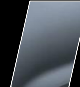
Gris azulado (1K3)