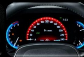
Pantalla multifuncional 7"