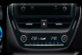
Aire acondicionado Bi-zona