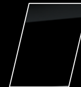
Negro mica (209)