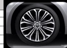
Rines de aleación de 17"