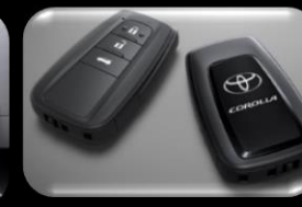
Control de entrada inteligente