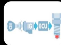
Inmovilizador de motor