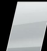
Super Blanco (040)