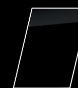
Negro Actitud (218)