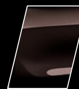
Marrón Café (4W9)