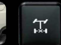
Bloqueador Dif. trasero