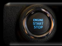
Botón de arranque