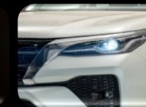
Luces Bi- LED