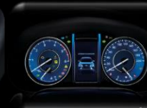
Pantalla TFT 4.2" multi-información