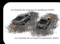
Sistema de arranque en pendientes (HAC)