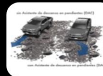
Sistema de arranque en Descenso (DAC)