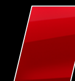
Rojo Carmesí Metalizado (3T6)