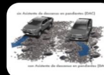
Sistema de arranque en Descenso (DAC)