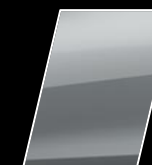
Plata Metalizado (1D6)