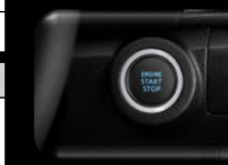
Botón de arranque