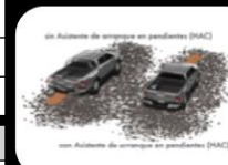
Sistema de arranque en pendientes (HAC)