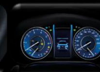
Pantalla TFT 4.2" multi-información