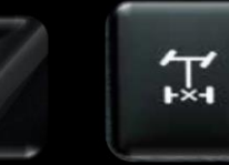
Bloqueador Dif. trasero