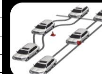
Frenos ABS con distribución electrónica de frenado (EBD)+ Asistente de Frenado (BA)