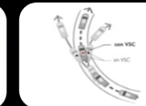
Control de estabilidad (VSC)