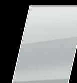
Super Blanco (040)